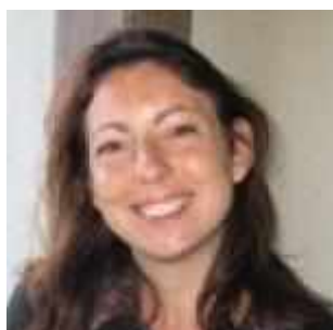
פרופ' סופי וולש