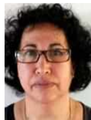
פרופ' יעל אידיסיס