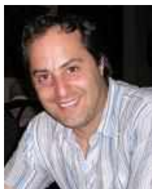
פרופ' משה בן סימון