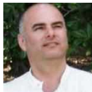
פרופ' נתי רונאל