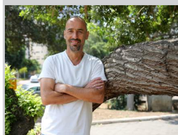
פרופ' תומר עינת